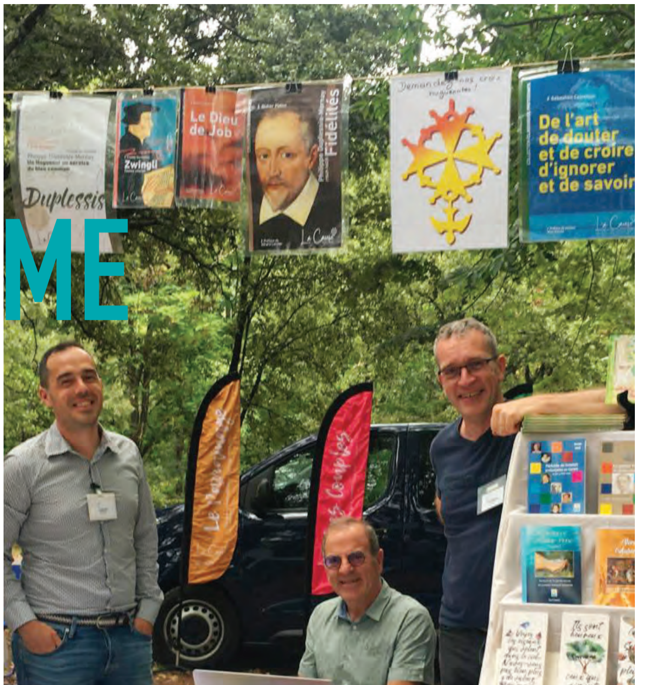
La Fondation La Cause, Musée du désert, cet été...

Vous êtes nombreux à plébisciter les romans historiques de La Cause, un moyen agréable d'apprendre l'Histoire à travers