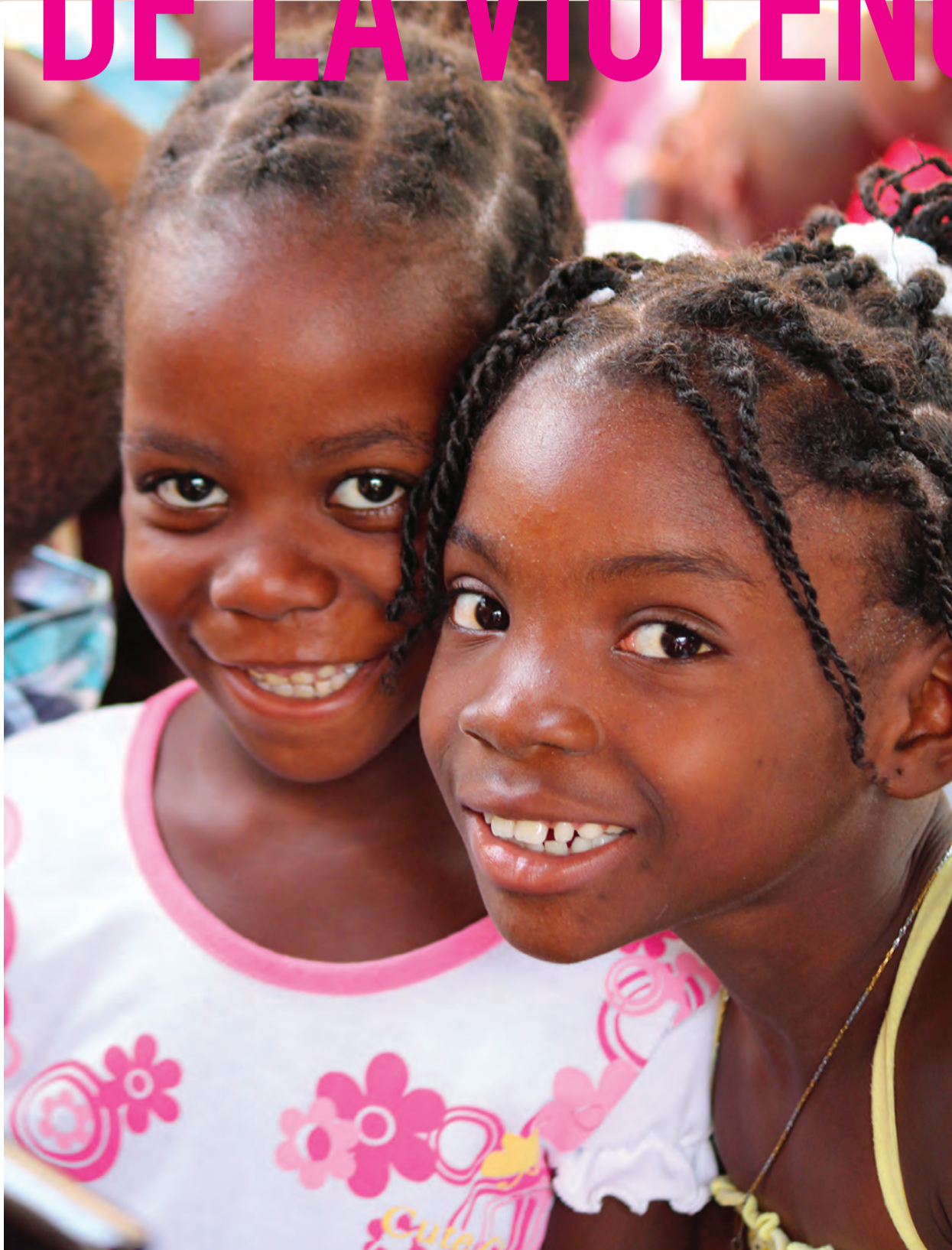
Deux jeunes filles du centre Rogach à Cité-Soleil, Port-au-Prince.

Par Christon St Fort Directeur exécutif de la Fédération des Écoles Protestantes d'Haïti